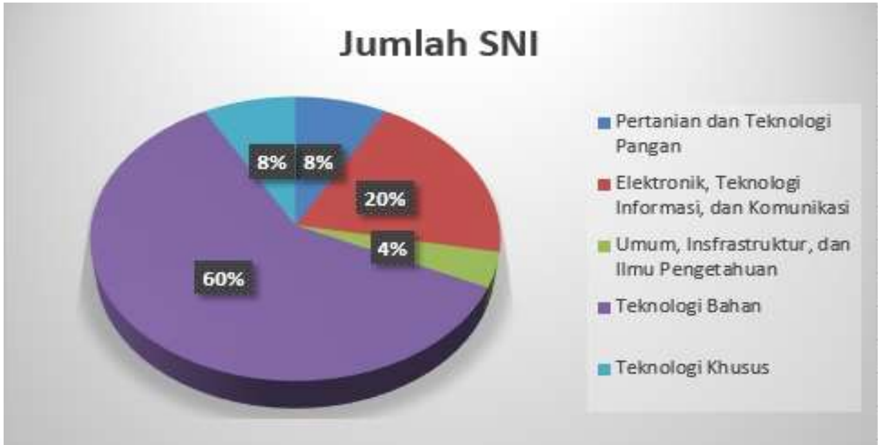
Diagram pie rekapitulasi SNI yang ditetapkan bulan September Tahun 2020