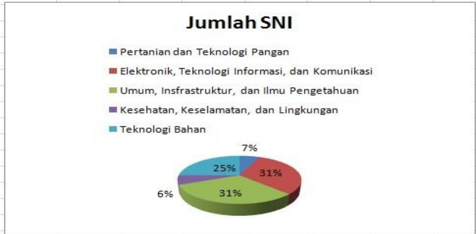
Diagram pie rekapitulasi SNI yang ditetapkan bulan Maret Tahun 2020