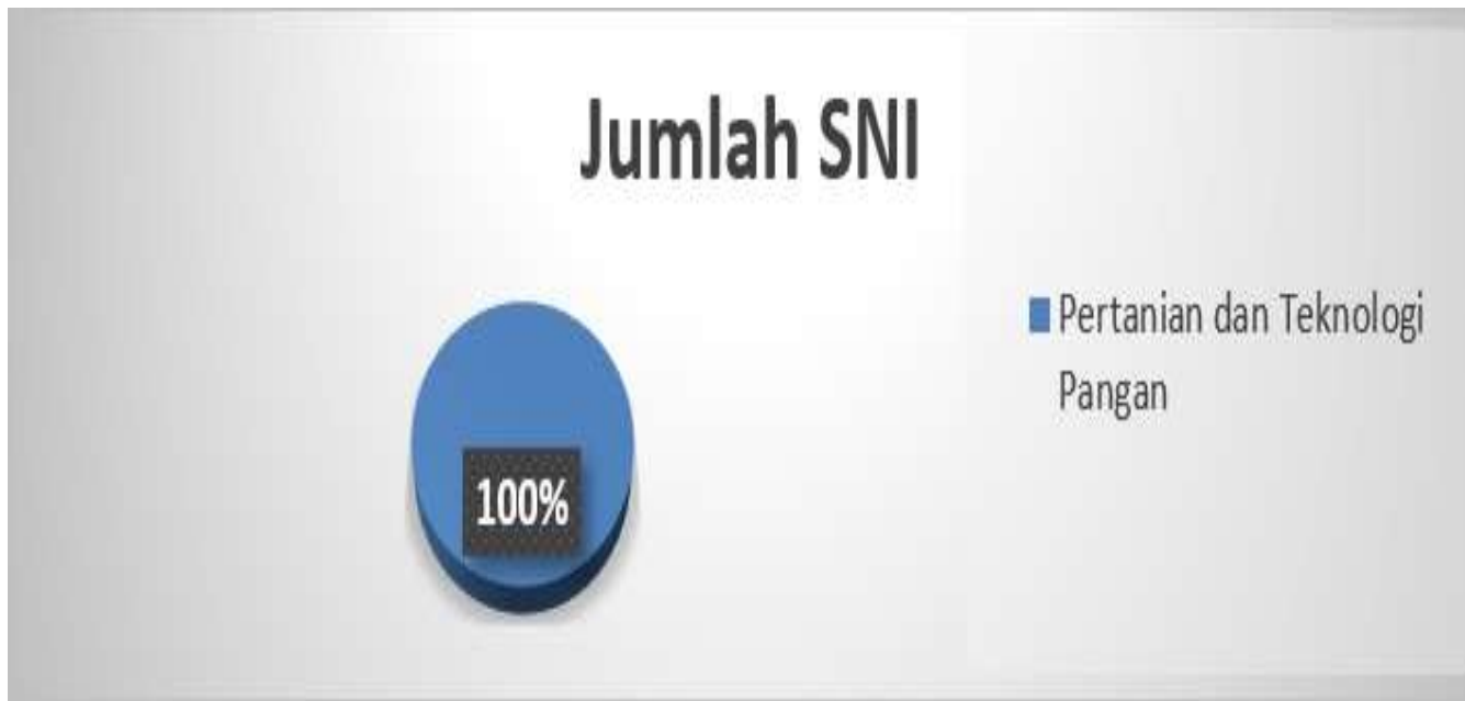
Diagram pie rekapitulasi SNI yang ditetapkan bulan Juni Tahun 2021