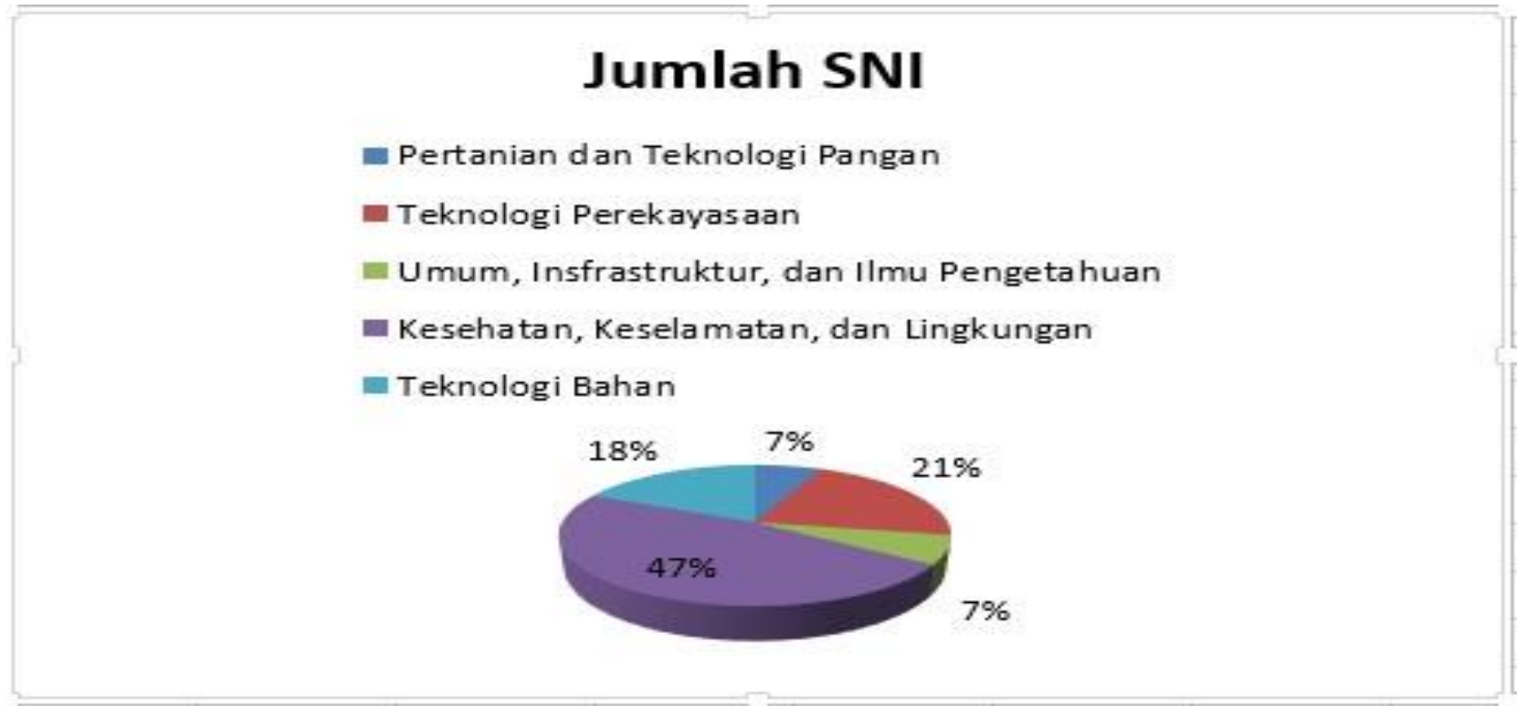
Diagram pie rekapitulasi SNI yang ditetapkan bulan Juni Tahun 2020