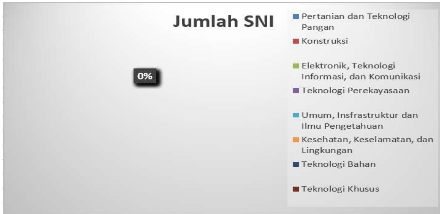
Diagram pie rekapitulasi SNI yang ditetapkan bulan Januari Tahun 2021