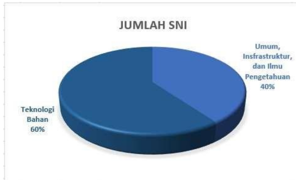
Diagram pie rekapitulasi SNI yang ditetapkan bulan Januari Tahun 2020