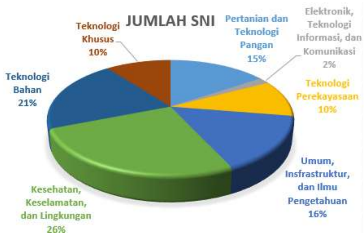
Diagram pie rekapitulasi SNI yang ditetapkan bulan November Tahun 2019