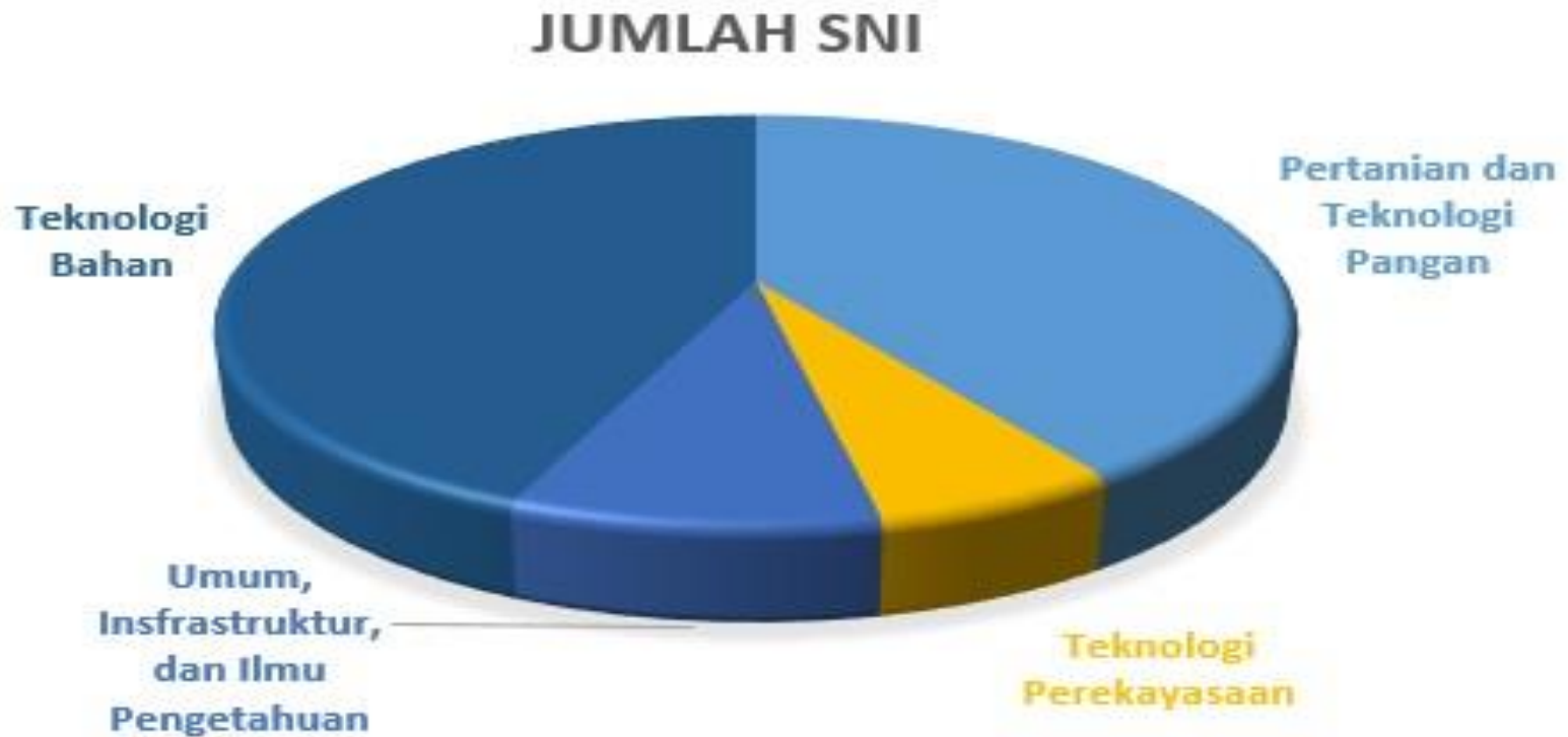
Diagram pie rekapitulasi SNI yang ditetapkan bulan Mei Tahun 2019