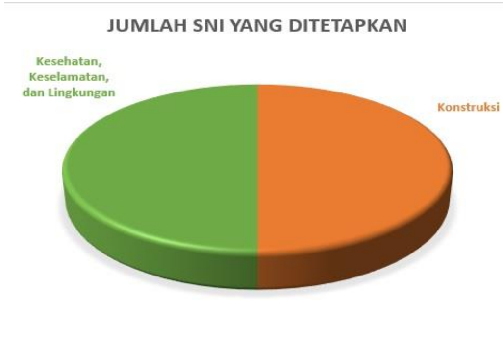
Diagram pie rekapitulasi SNI yang ditetapkan bulan Januari Tahun 2019