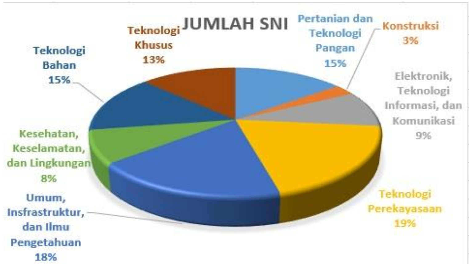
Diagram pie rekapitulasi SNI yang ditetapkan bulan Desember Tahun 2019