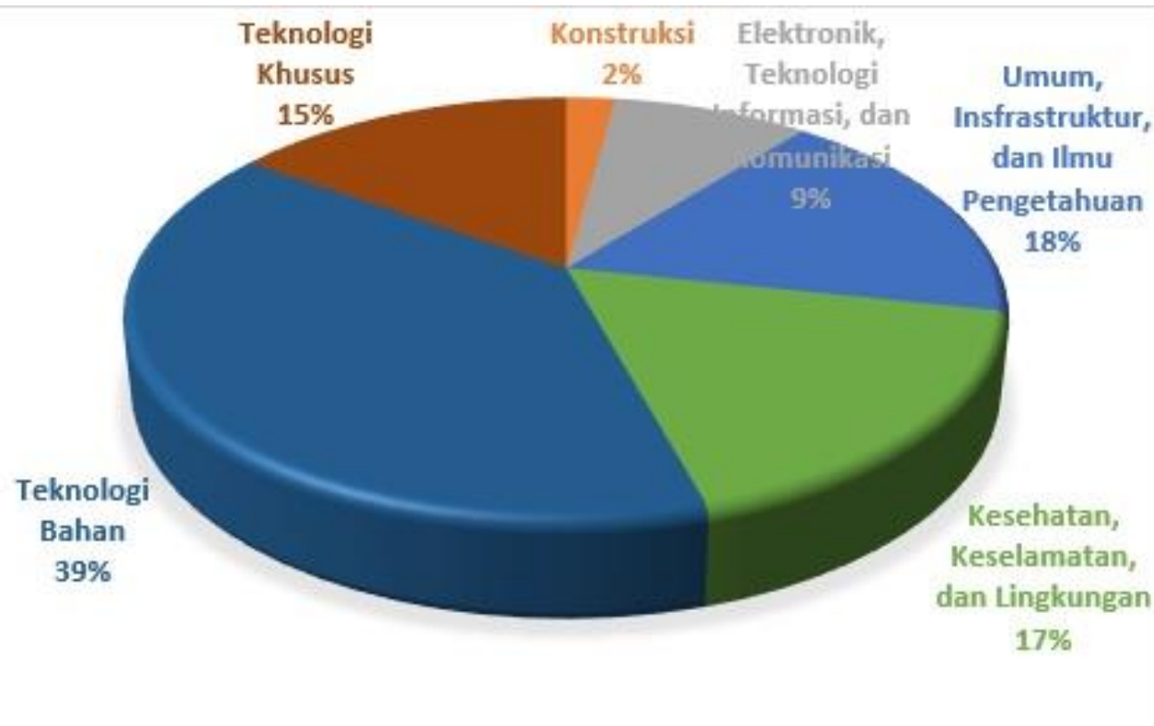
Diagram pie rekapitulasi SNI yang ditetapkan bulan April Tahun 2019