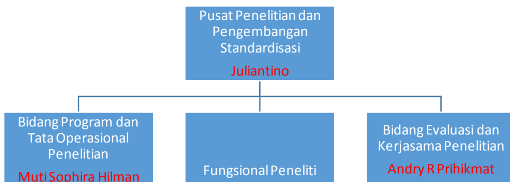
Gambar I.1 Struktur Organisasi Bidang program dan tata operasional penelitian

Struktur Bidang evaluasi dan kerjasama penelitian dapat dilihat pada gambar berikut.