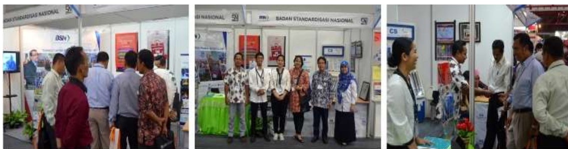
Gambar 2. Berbagai pameran yang diikuti oleh BSN pada tahun 2016